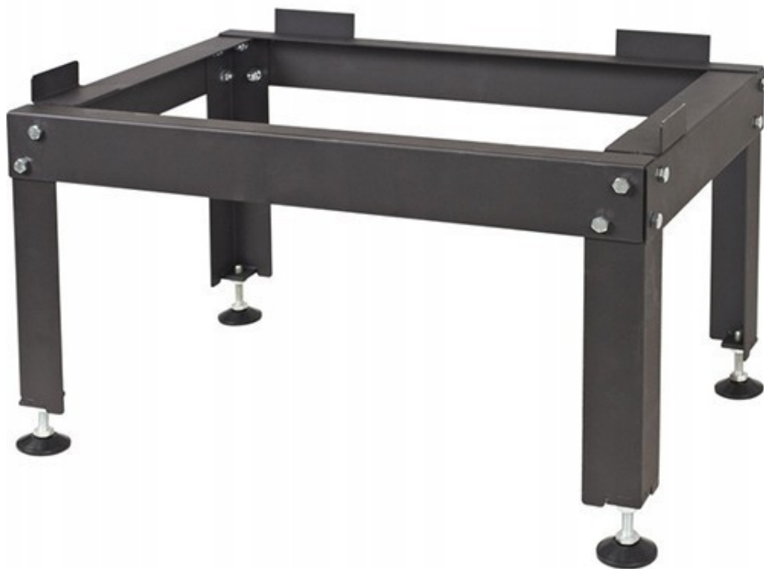
3. Podstawa pod wkład MAJA i ANTEK

Podstawa pod wkład MAJA i ANTEK umożliwia stabilne ustawienie wkładu kominkowego, możliwość regulacji wysokości nóg.